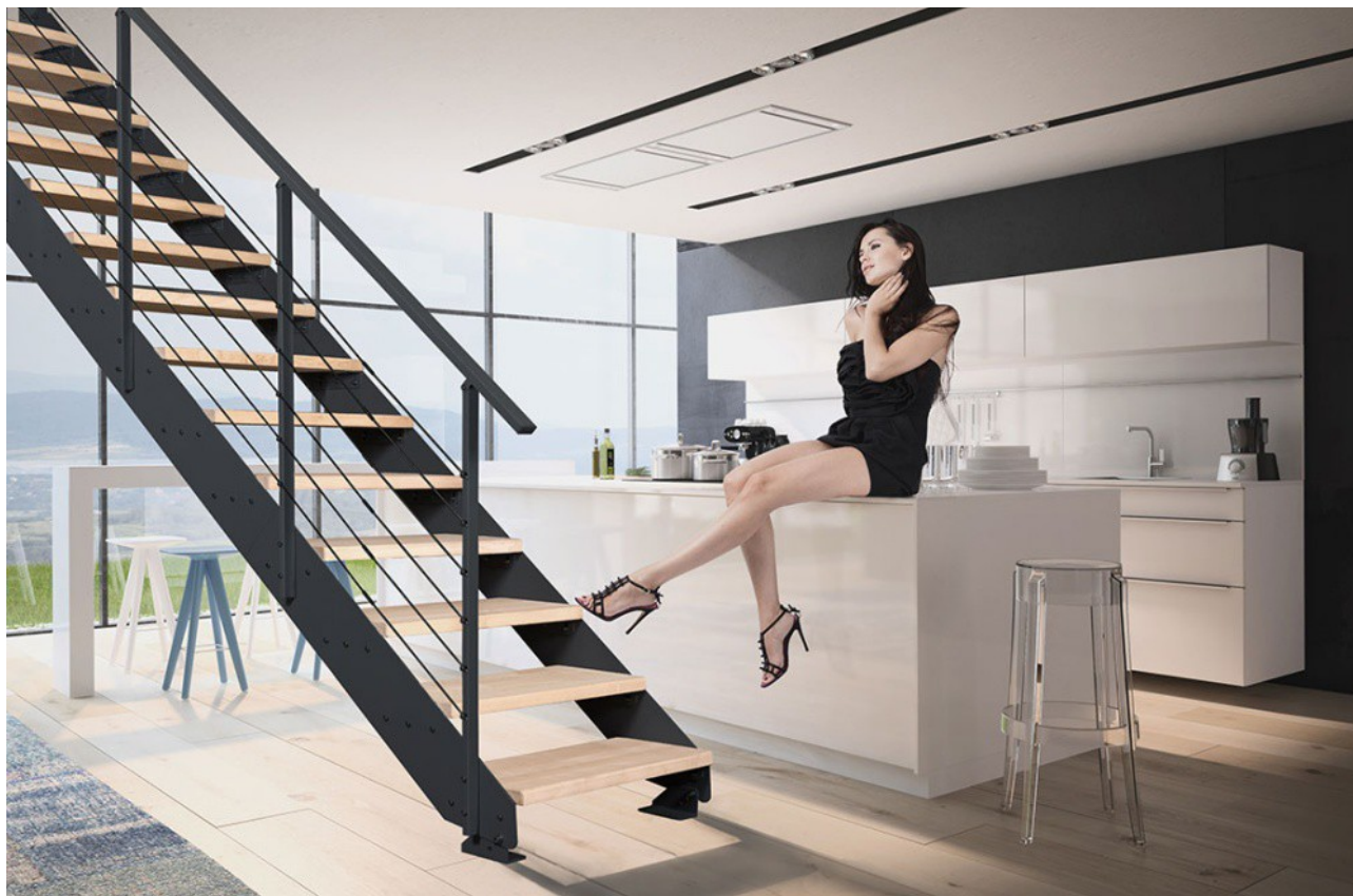
Schody Prosto Loft

Najbardziej powszechne rozwiązanie to otwór o kształcie kwadratu, w który schody wpisują się idealnie. Jednak równie dobrze mogą funkcjonować one w otworze okrągłym, a nawet bez niego (wejście na antresolę). Poszukujesz trwałych i bezpiecznych schodów kręconych? Poznaj naszą kolekcję — to zestawy, z którymi stworzysz udaną aranżację we wnętrzach o różnych stylach. Tych klasycznych, nowoczesnych oraz industrialnych typu "loft".